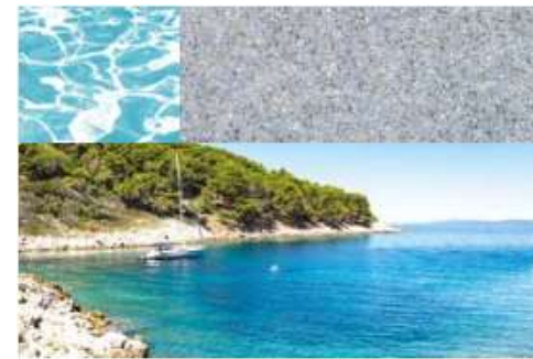
Nova® Grey | Croatia