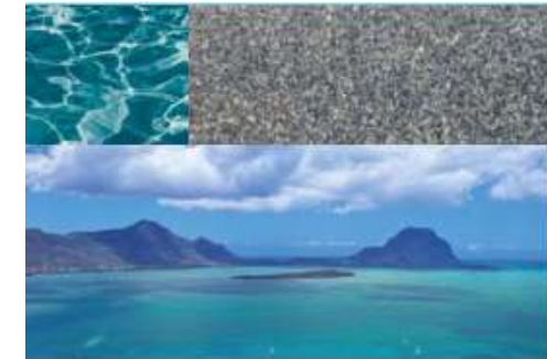
Nova® Anthracite | Seychelles