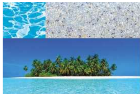
Nova® Stone | Réunion Island

Durch die zusätzliche Verwendung von Carbon im patentierten Ceramic-System werden die strukturell sehr beanspruchten Bereiche des Pools verstärkt. Carbon hat die höchste Druckfestigkeit aller Verstärkungsmaterialien. Dasselbe Material, das aufgrund seiner hohen Festigkeit auch bei Automobilen, Schiffen und Flugzeugen Verwendung findet.