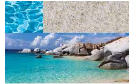
Nova® Pearl | Zanzibar